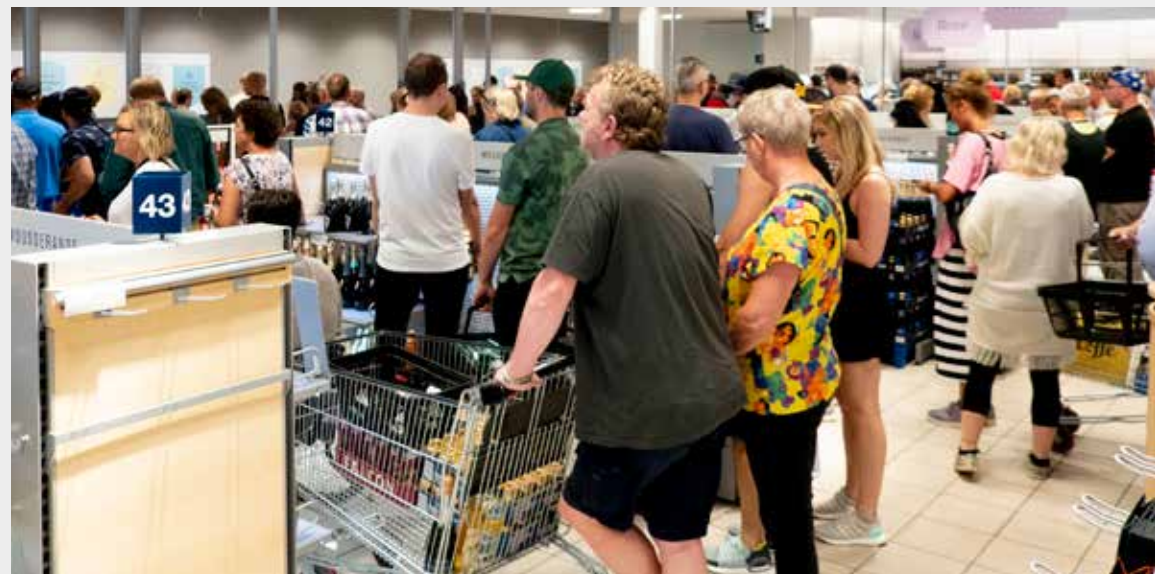
I KØ: Slike køer er en sjeldenhet på Vinmonopolet, men forekommer så å si daglig i Sverige.